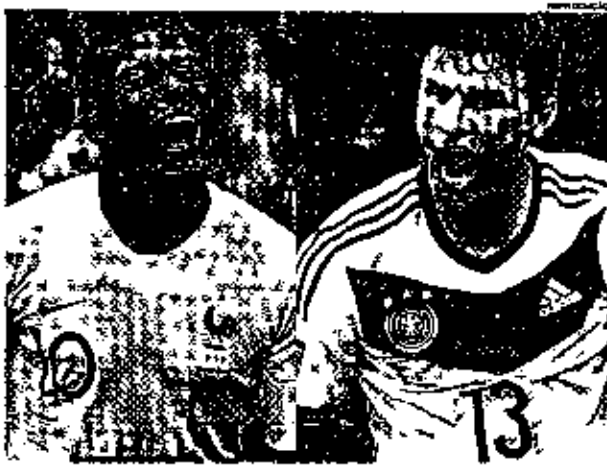
Kylian Mbappé e Thomas Müller em campo da França e Alemanha que se enfrentam hoje na Eurocopa

Pelo lado da seleção de Alemanha, o time chega em momento de muita confiança. Nos últimos jogos do técnico Joachim Löw, que se